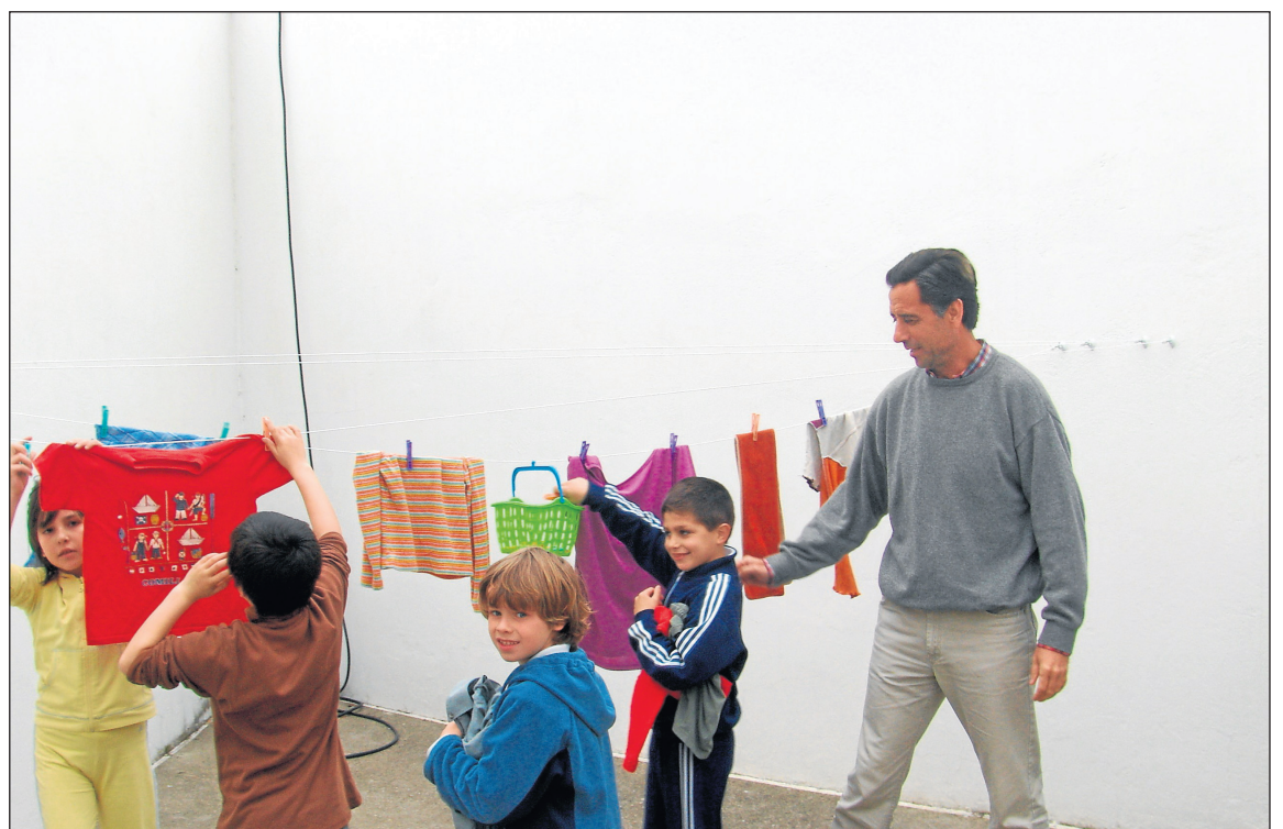
Actividades del proyecto premiado 'El aula hogar en el currículum de Educación Primaria'

A esta segunda convocatoria se han presentado 44 trabajos y se han concedido dos premios, dotados con 6.000 euros cada uno